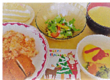
クリスマス行事食

これからの寒い季節、もち菜をお雑煮に入れてたくさん食べて、風邪知らずで冬を越しましょう！！