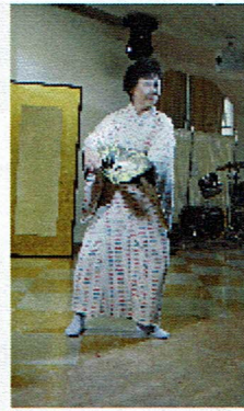
デイケア スタッフ

職員がツリーやサンタの衣装を着たり、利用者様にはサンタの帽子をかぶっていただいたりして、皆で一緒に楽しみます。