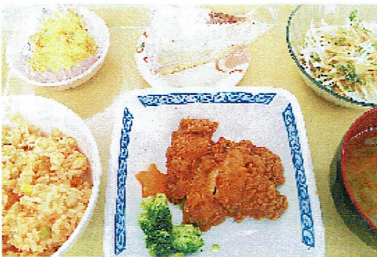
12月クリスマス行事食