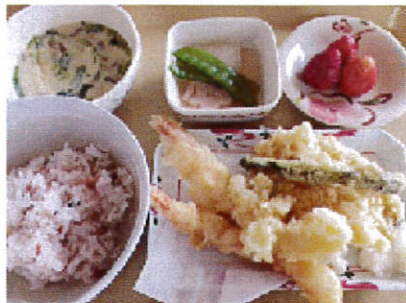
梅しそご飯と天ぷら