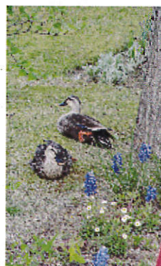
鴨もひなたぼっこ♪

お散歩の後は、園内にあるレストランで皆さんお待ちかねのコーヒータイム。最終日はお天気にも恵まれ、外のウッドデッキで過ごす事が出来ました。