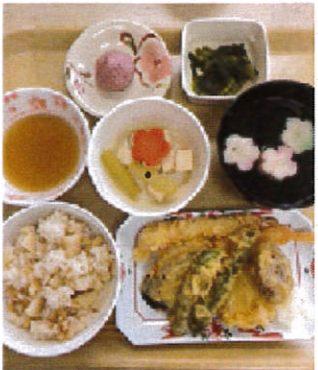
筍ごはん と 天ぷら

4月の行事食です。春らしく、筍ごはん、天ぷらの盛り合わせ、露の煮物等が提供されました。こんな物が食べてみたい、というリクエストがございましたら、ぜひ教えて下さい。