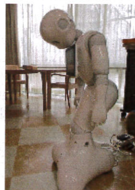
うなだれペッパー君