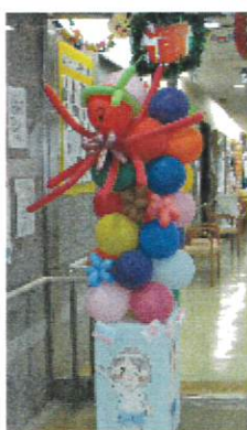
玄関のバルーンアート