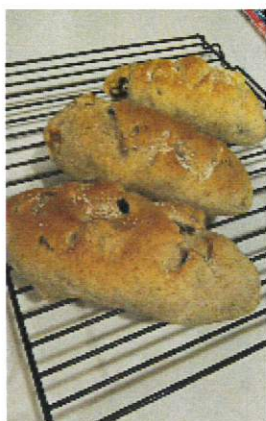
食欲の秋なので、食べ過

何年経っても失敗したりもつとこうすれば良かったかな：等落ち込む事も多々あります。そんな時のストレス解消法は手捏ねパン作りです。最近友人に勧められ参加した、パン作り教室に行つてから、スッキリしたい日は夜な夜なパン生地を捏ねて頭を空っぽにしています。