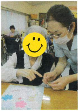
お好みの色を選びます

もちろん「花より団子」のご要望にもお応えし、苺のロールケーキとプリンをご用意しました。皆様の笑顔も満開です。