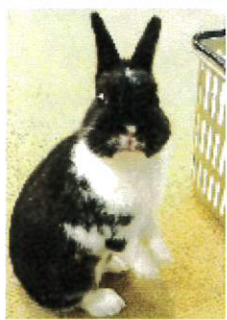
今年もよろしく 願います ポポ五歳